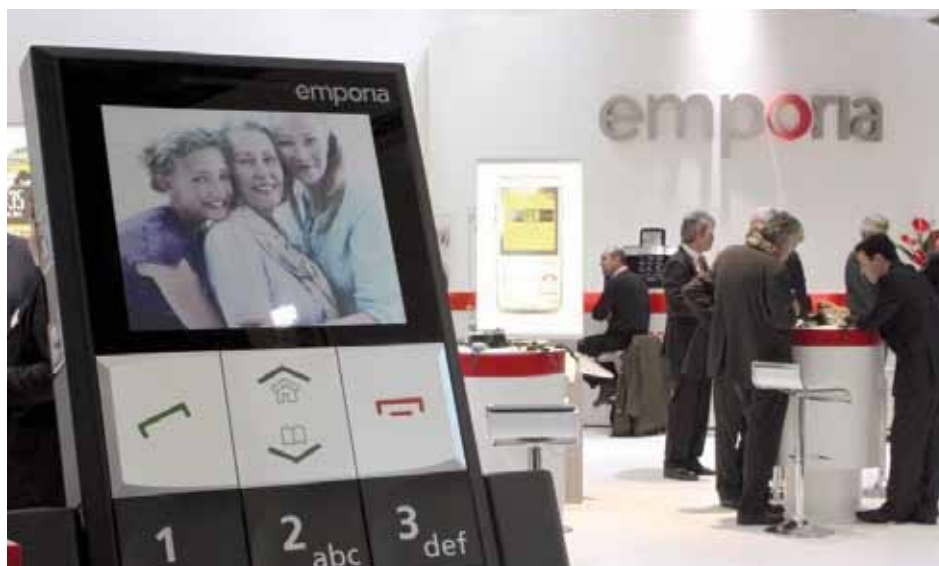
Emporia Telecom au World Mobile Congress.