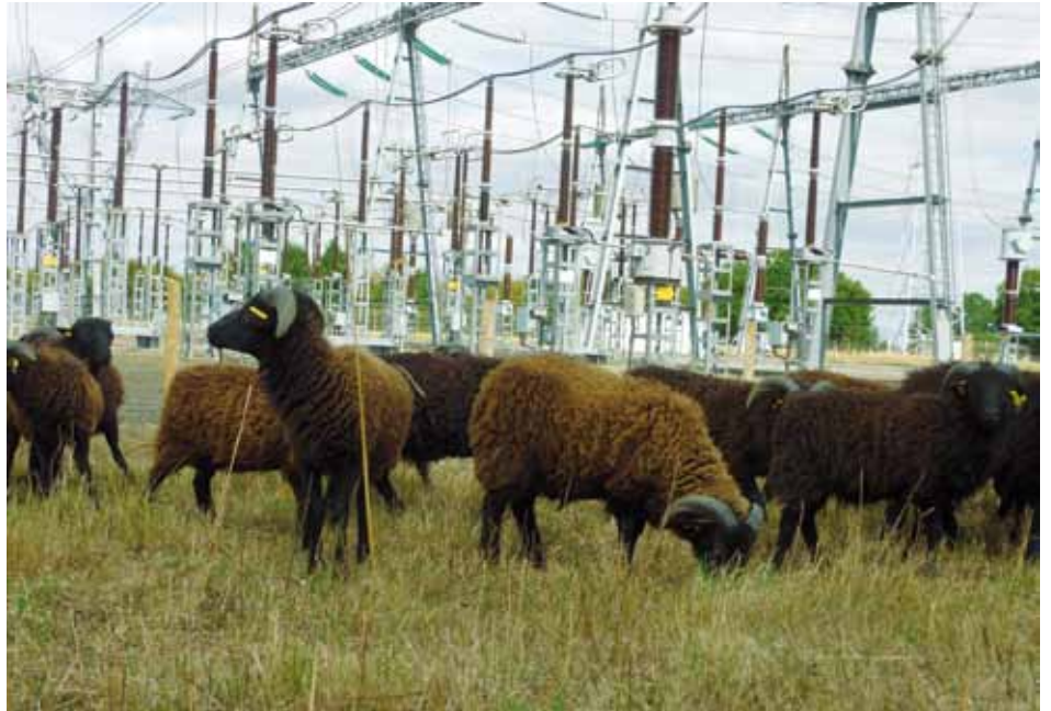
Les « tondeuses écologiques » de RTE au poste électrique de Louisfert (44).

EVS, le leader français de la prestation de services dans les industries de la filière viande a signé, le 11 janvier dernier, une convention avec les Pôles Emploi Bretagne et Pays de la Loire en vue de recruter 600 personnes en 3 ans. Une initiative